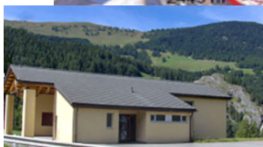
Salle de la Fraternité

https://www.skiresort.fr/domaine-skiabile/vicheres-liddes/plan-pistes/