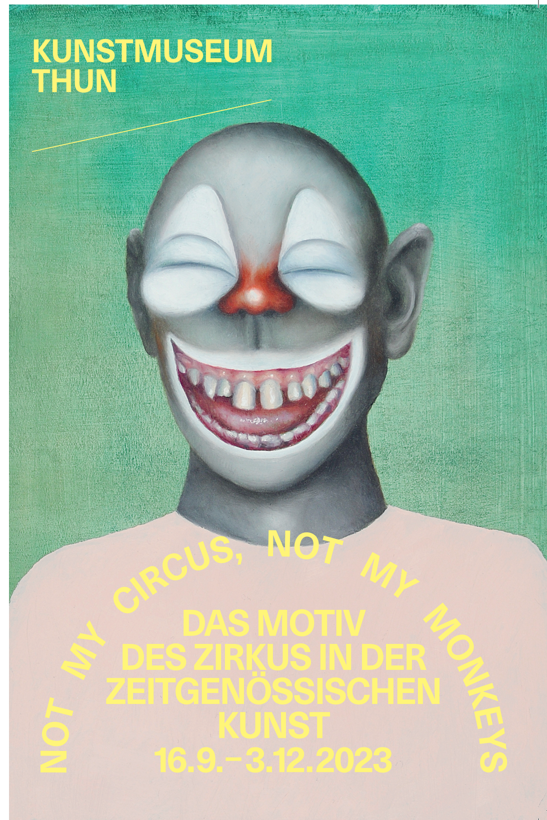
Francisco Sierra, Clown II (aus: Facebook ), 2008, Öl auf Karton, 21 x 15,5 cm, Kunstmuseum Bern, Sammlung Stiftung Gegenwart

CANTONALE BERNE JURA 16.12.2023 – 21.1.2024