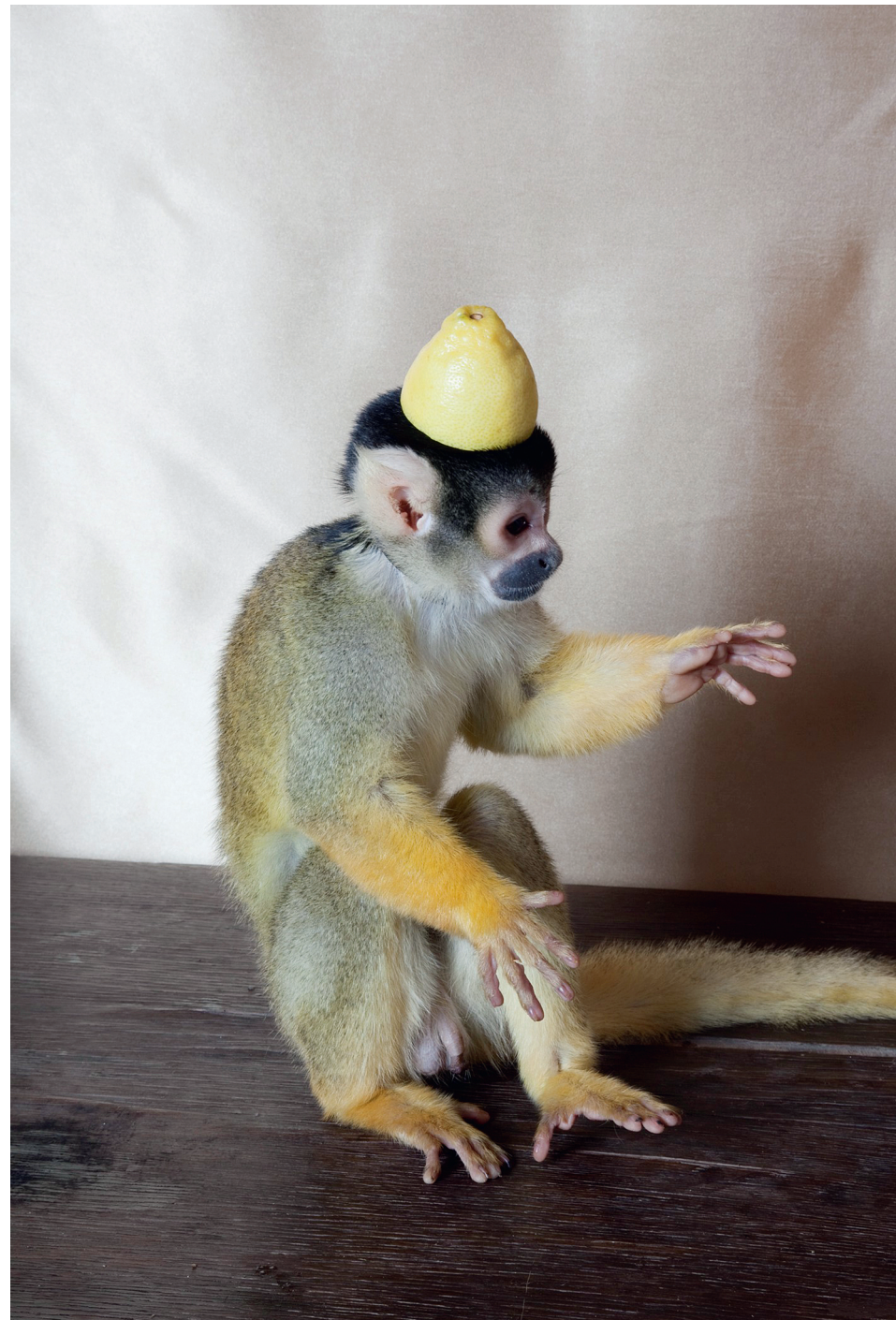
Istvan Balogh, Monkey with Lemon , 2009, Lambda-Print, 1-4, 60 x 40 cm.